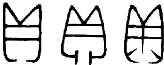
清代著作《說文古籀補》中所錄的甲骨文「貝」字

馬克思有句名言：「雖然黃金與白銀都不是註定要充當貨幣的角色，但是貨幣卻只可以是黃金與白銀。」 7 看看當今世界，美元的國際地位受到挑戰，黃金價格卻不斷上升。從廿多年前不到 300 美元一盎司，漲到現在約 2,300 美元，升勢仍然未止。不僅國際炒家大肆收購儲備黃金，很多國家國庫也增持黃金作為國家儲備的工具，百姓也將黃金當成最穩健的投資工具，還真不能不讚歎馬克思對經濟的洞察能力。