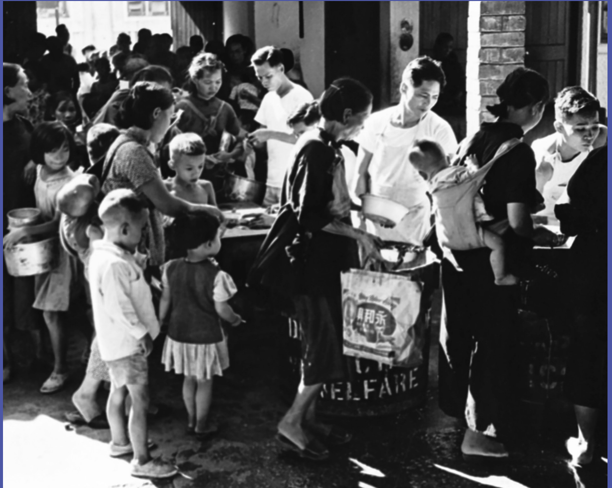
九龍老龍坑山谷道寮屋區居民輪候宗教團體的救濟，1959年。