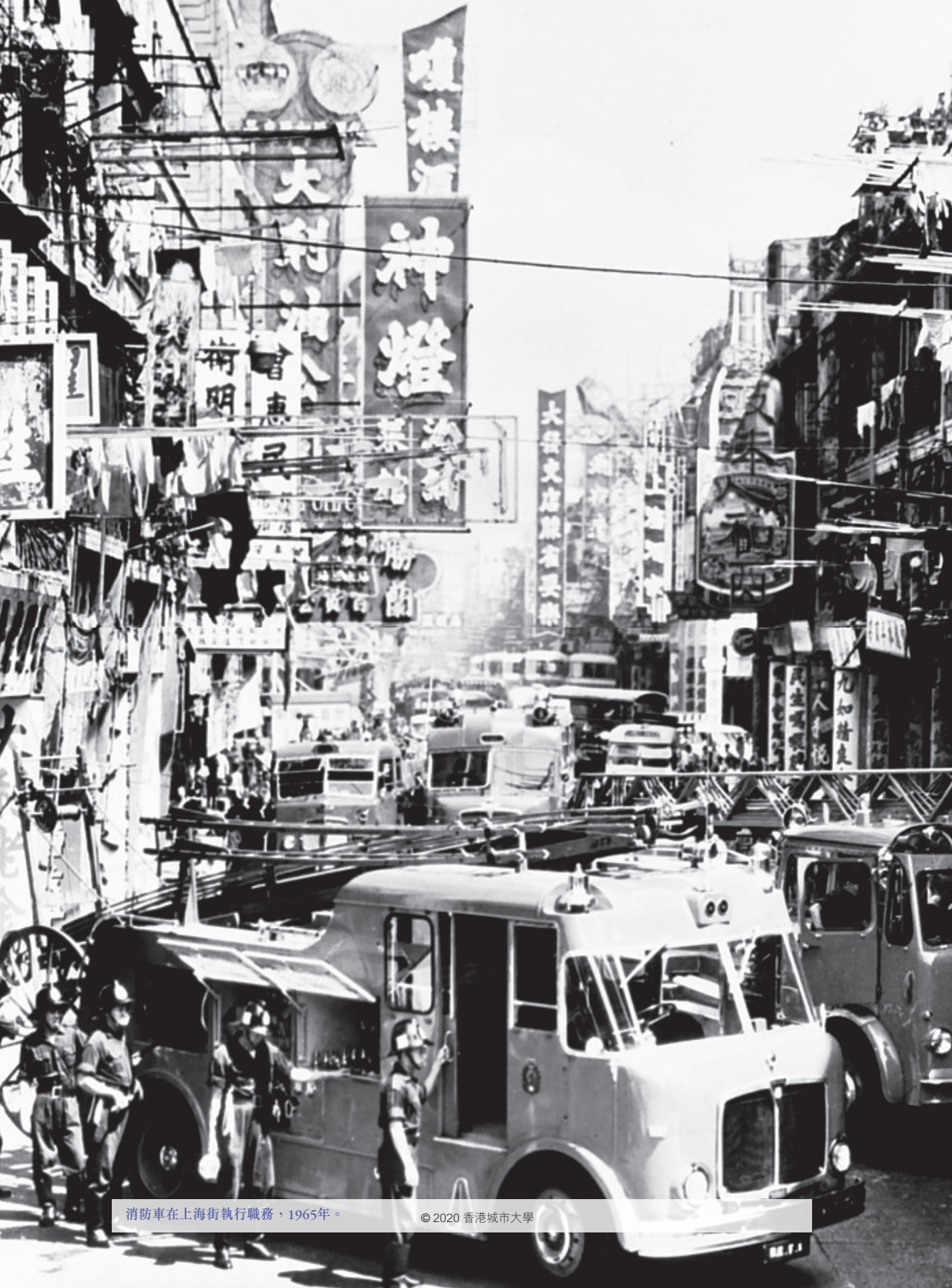
消防車在上海街執行職務，1965年。