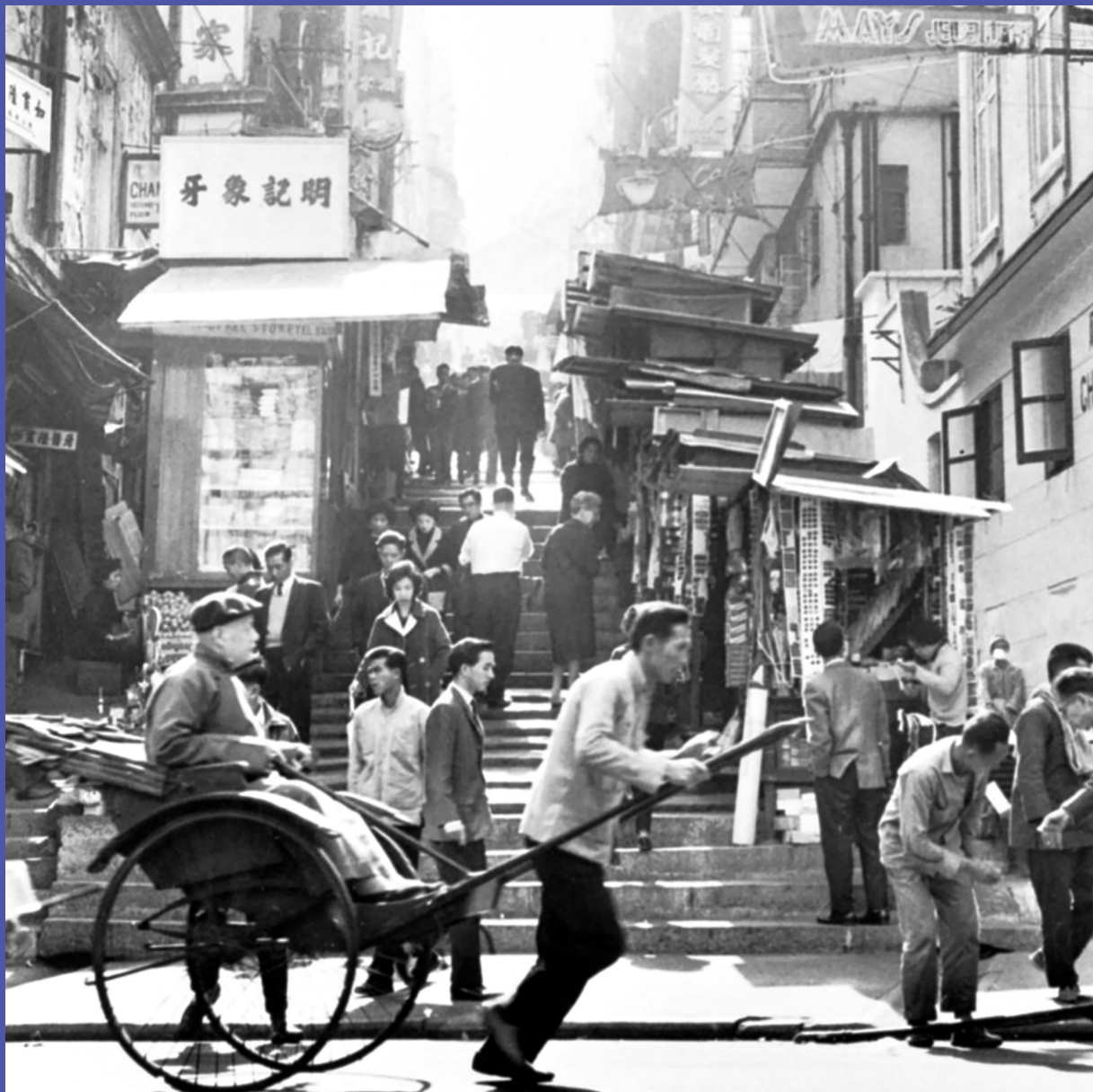
中環砵典乍街攤檔，1964年。