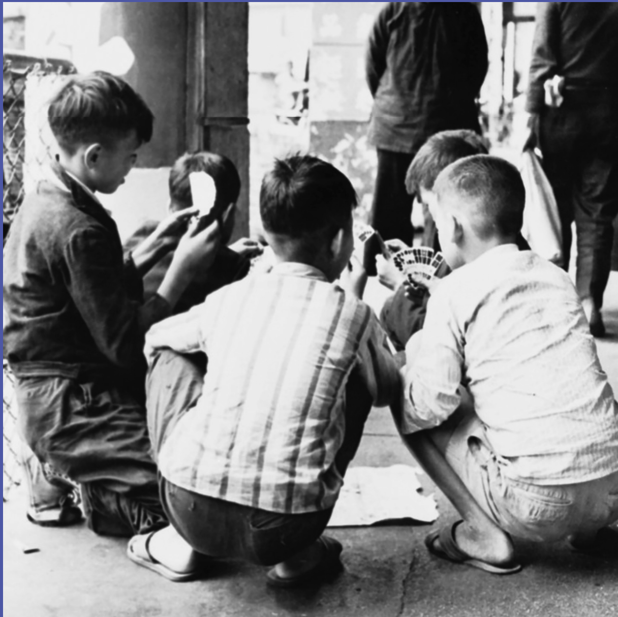
正在玩紙牌的街童，1962年。