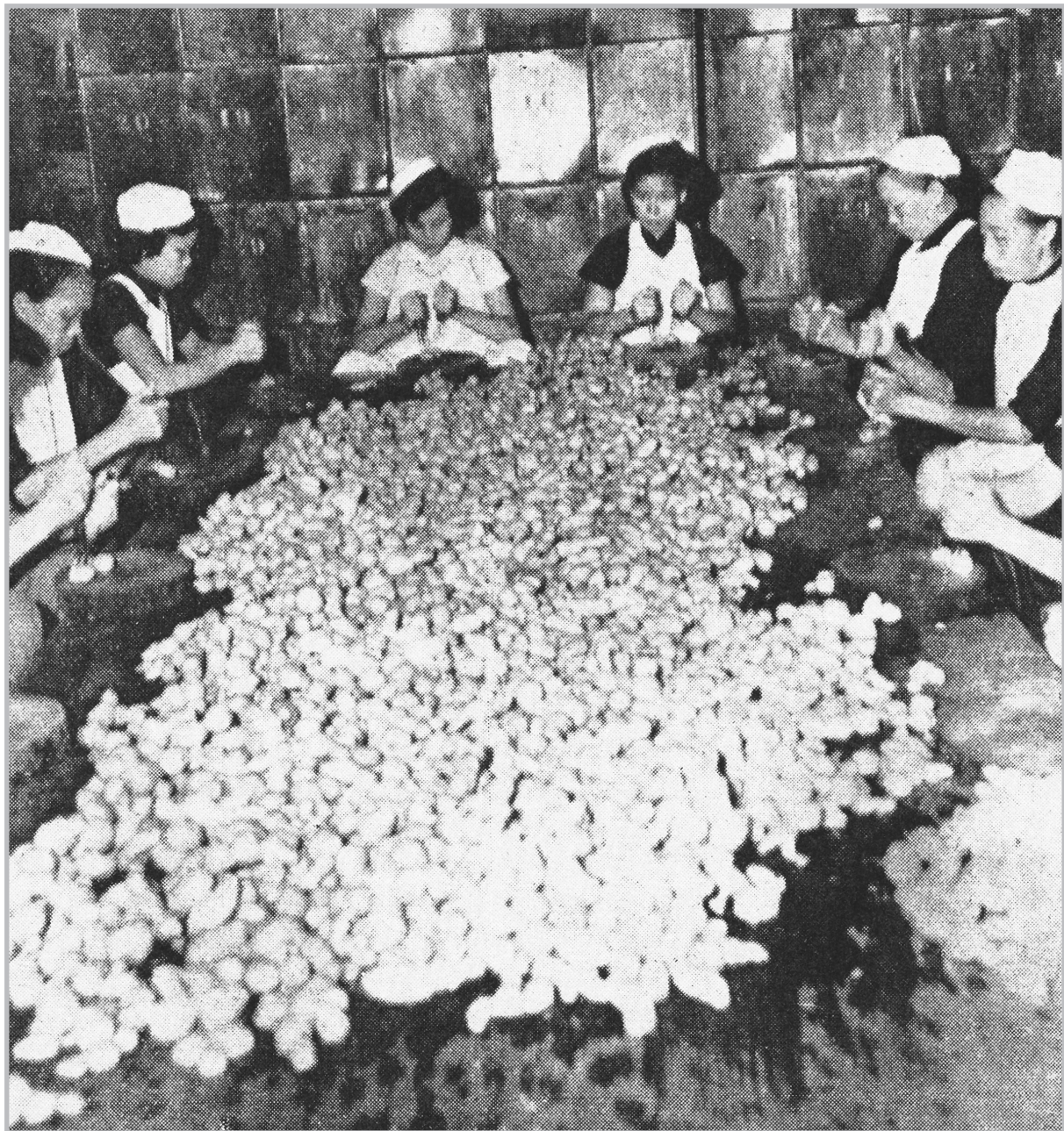
生薑混合糖漿前的工序。