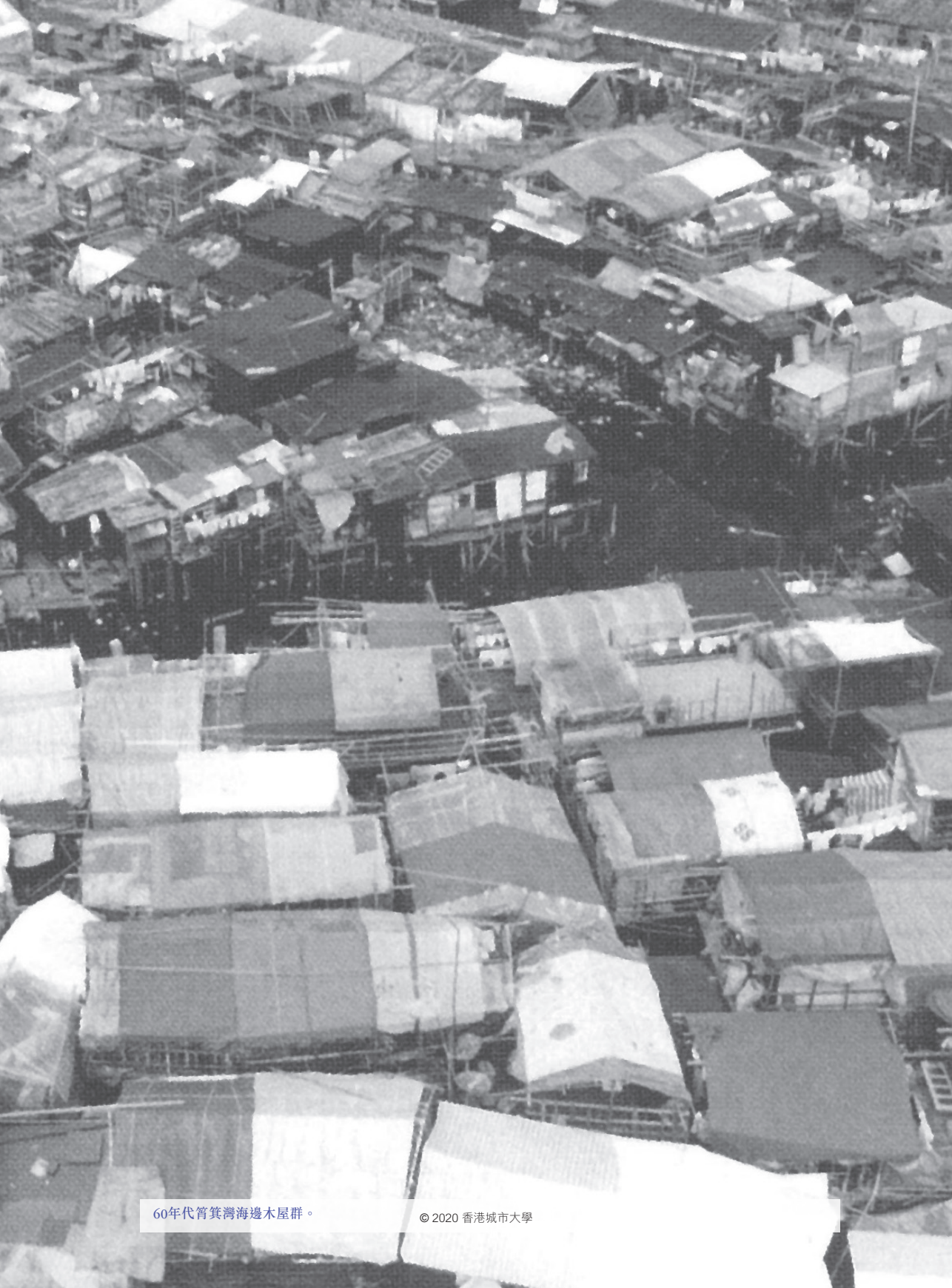
60年代筲箕灣海邊木屋群。