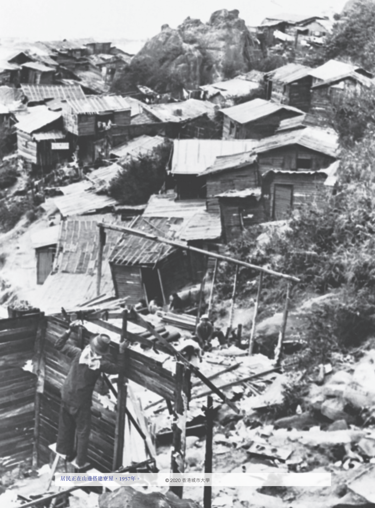
居民正在山邊搭建寮屋，1957年。