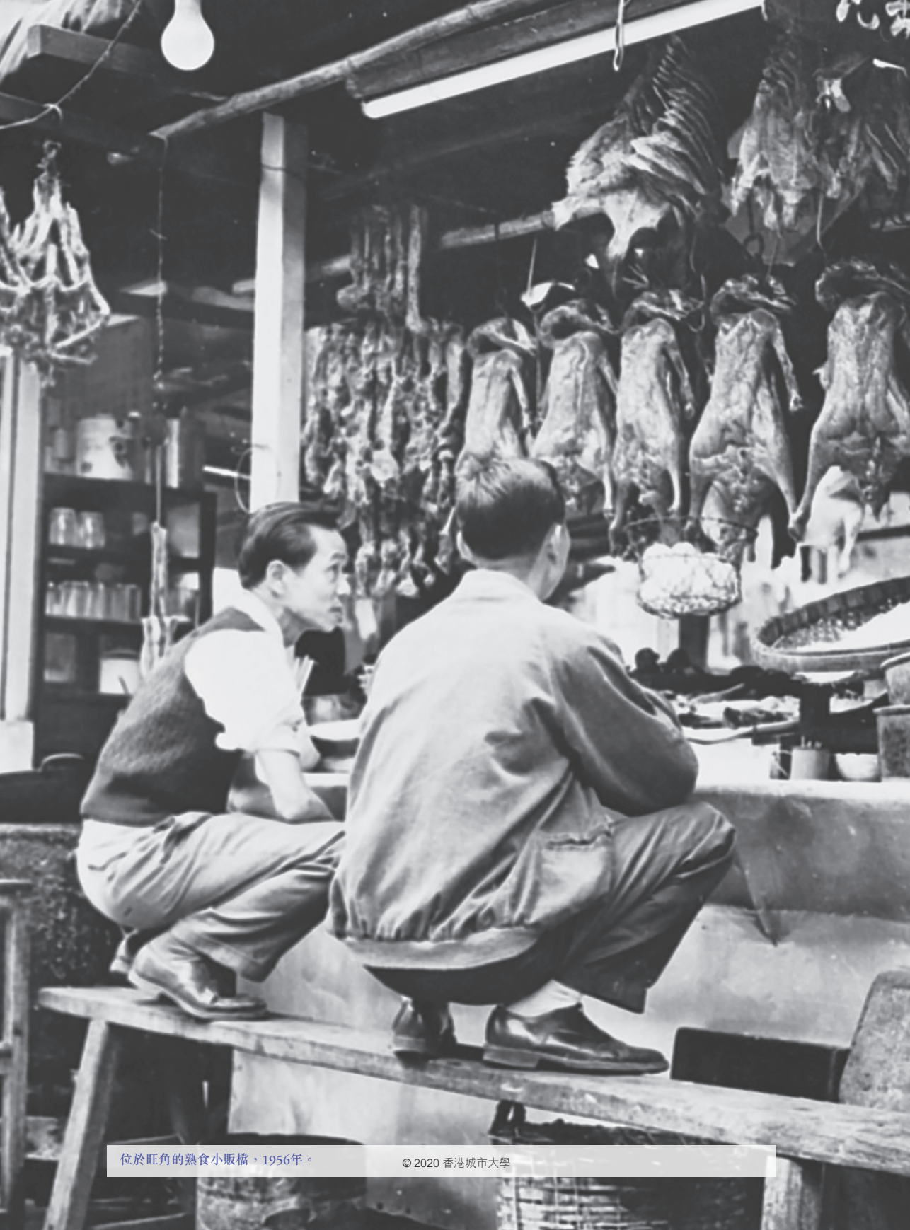
位於旺角的熟食小販檔，1956年。