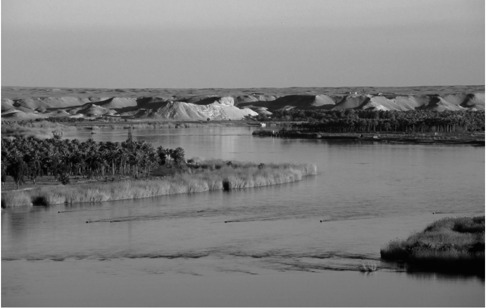
▲ 幼發拉底河縱貫伊拉克全境，與底格里斯河都是世界著名的河流，自古以來已是伊拉克的生命之源。

底格里斯河是伊拉克的第二母親河。底格里斯河發源於土耳其境內、小亞細亞的東部亞美尼亞高原東南高地的哈黎爾湖（Lake Hazar），與幼發拉底河自西向東南流貫伊拉克全境，在下游庫兒馬阿里河（Qarmat Ali River）的河口庫爾納與幼發拉底河匯合，最後注入波斯灣。底格里斯河全長1,718公里，其中約1,418公里在伊拉克境內，約佔底格里斯河全長的82.5%。