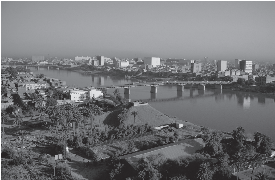
▲ 底格里斯河流經首府巴格達，河東岸的魯薩法區是巴格達市中心。

歷史學家考證巴格達的名字出於古波斯語 Bagh-dagh，Bagh的意思是「神」，dagh的意思是「給予」，合起來即為「神賜」的地方，也有「真正的花園」之稱。