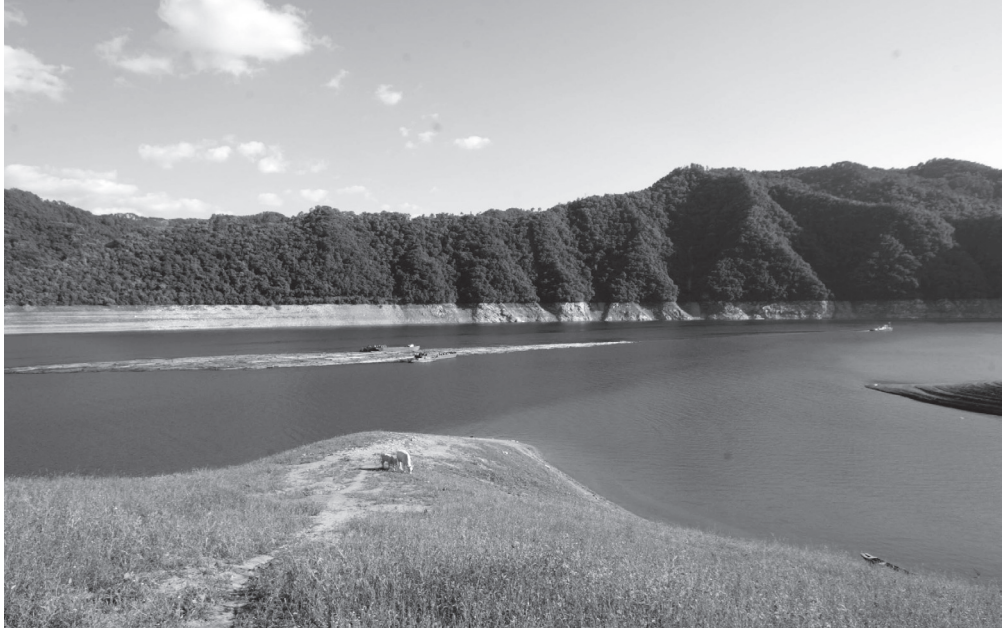
▲鴨綠江上游地區盛產林木，但由於根本沒有陸路交通，只能用水陸運輸。上個世紀初，鴨綠江豐富的自然林木資源和水資源，都以原始的方式運輸，江中放木排特別盛行，如今看到江中放木排很是罕見。

東部有海拔 2,000 米以上的山 50 餘座，森林資源豐富；西海岸和南海岸地勢較平坦，大部分耕地分佈在這些山區，是北韓主要產糧區。北韓的第一高峰是將軍峰（Jiangjun Peak）（海拔 2,749 米）。北中部為蓋馬高原（Kaema Plateau），稱為北韓的「屋頂」。著名的山嶺有白頭山（Paektu-san）（中國稱長白山）、金剛山（Kumgang-san）、妙香山（Myohyang-san）等。