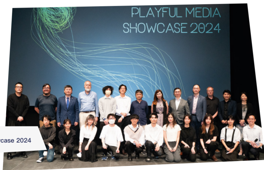
特别兴趣小组 Playful Media Showcase 2024